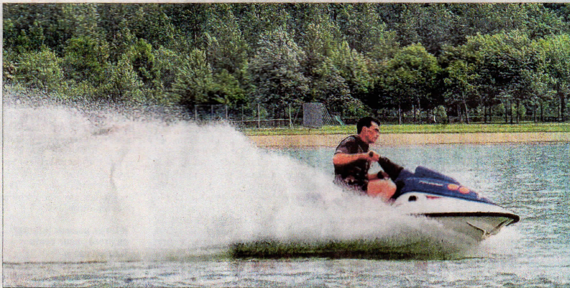
La motonautique va-t-elle bientôt envahir le lac Léman ? Face à cette éventualité, les associations se mobilisent.