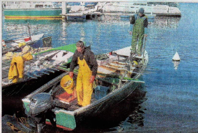
Les pêcheurs professionnels, tout comme les amateurs, sont sur le qui-vive. Ils craignent une « invasion infernale ».