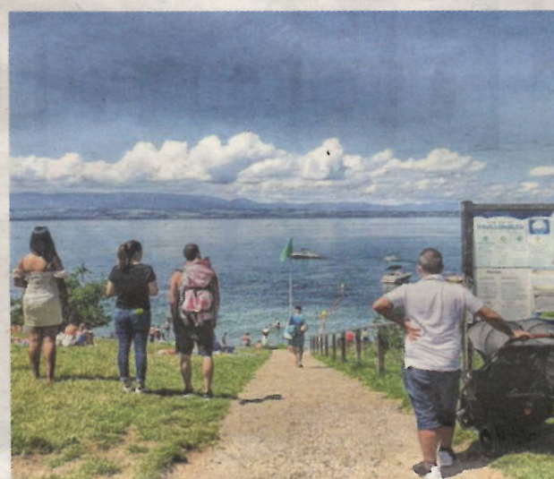
La plage de Saint-Disdille est l'une des trois plages de Thonon.

sauvages suivantes... jusqu'à la plage naturiste, elle aussi trop petite !