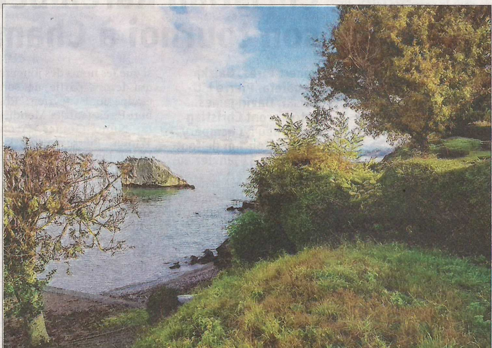
Depuis le parc de Corzent en direction de Rives, la balade s'achève au droit du bloc erratique dénommé Pierre Amour, faute au non-entretien du marchepied par le propriétaire de la parcelle.

L'association se propose d'ailleurs d'effectuer gracieusement le débroussaillage. La fin justifie les moyens. F.G.