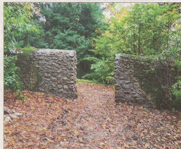
Mi-octobre, le mur d'enceinte du parc de Montjoux a été ouvert, mais seulement côté ouest.

“ Le marchepied correspond à l'ancien chemin des douaniers qui doit être accessible aux promeneurs, comme l'indique la loi sur l'eau de 2006. L'objectif est d'établir une continuité tout autour du lac. Peu à peu, on y arrive. Il y a, certes, encore des réticences tant de la part des riverains que des élus, mais les choses évoluent favorablement. ”