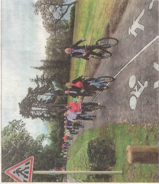
Tout le monde s'éclate sur l'Excenway